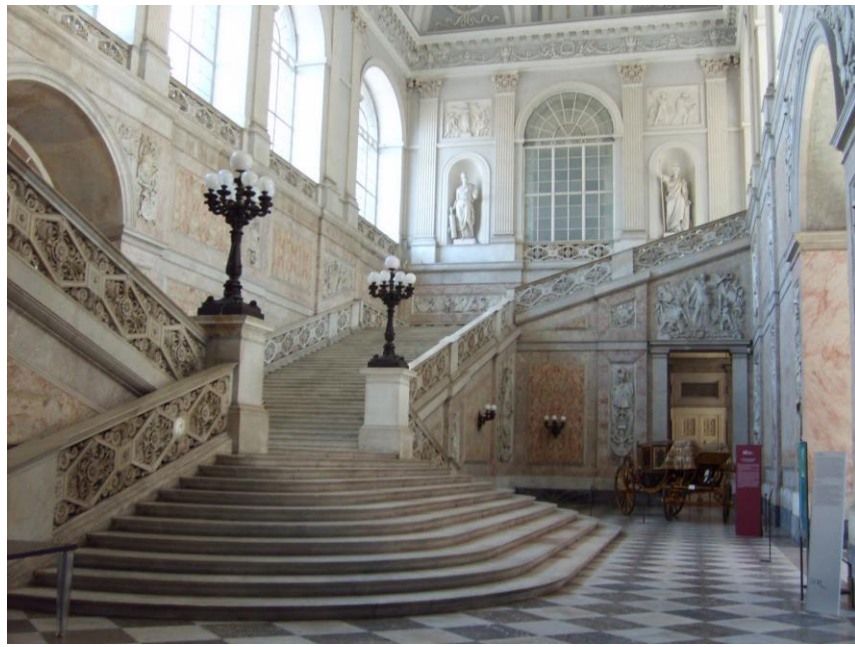
← Cappella Caracciolo di Vico in San Giovanni a Carbonara; ↑ Scalone di Palazzo Reale; ↓ Compianto del Cristo di Guido Mazzoni in S. Anna dei Lombardi