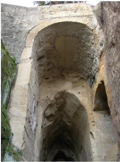
← Crypta Neapolitana;

DISCOVER NAPLES AND ITS SURROUNDINGS WITH A.N.T.A.R.E.S.